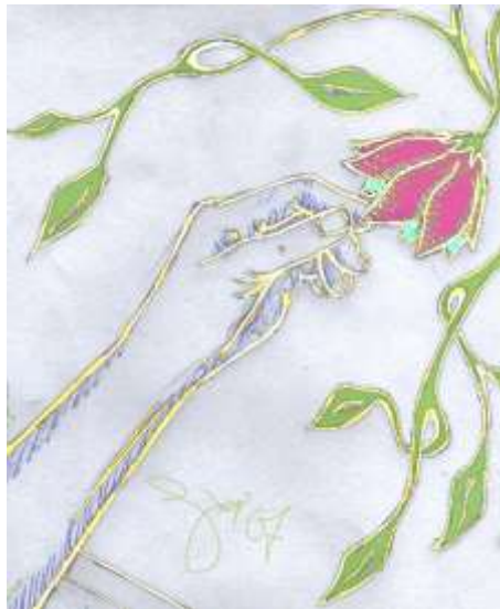
Lise B. Christoffersen