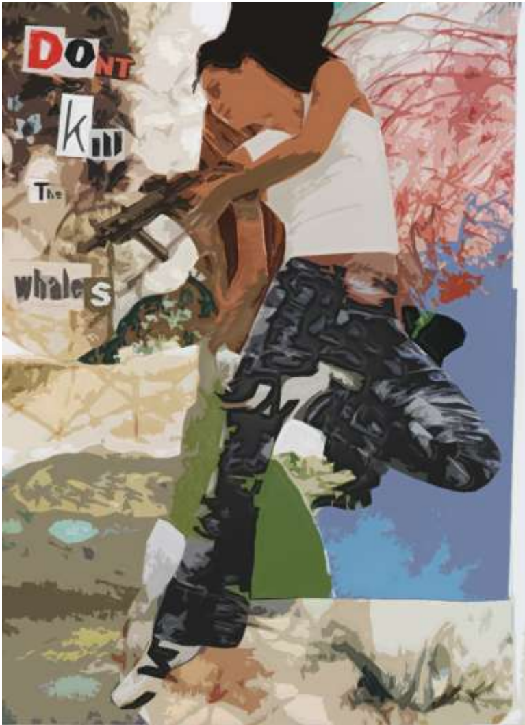
Lise B. Christoffersen